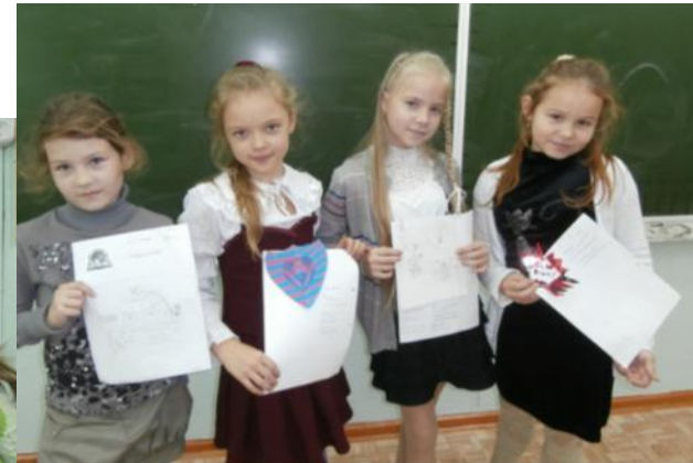
Мы ответы записали